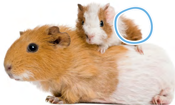
El conejillo de Indias